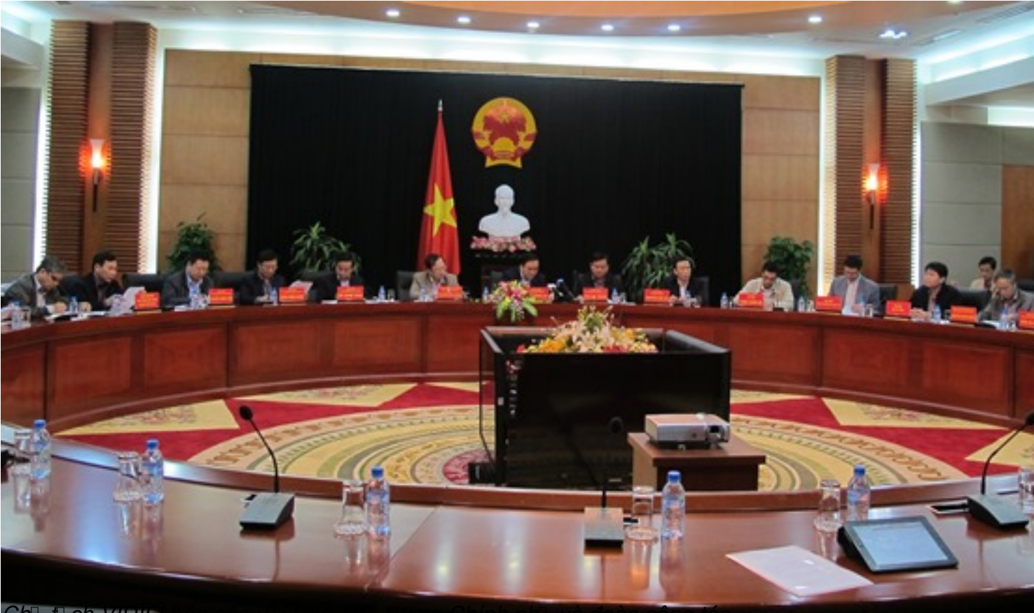
Chi đđch VIDIA báo cáo vđi Phó Thủ đđng Chính phủ và đđan công tác