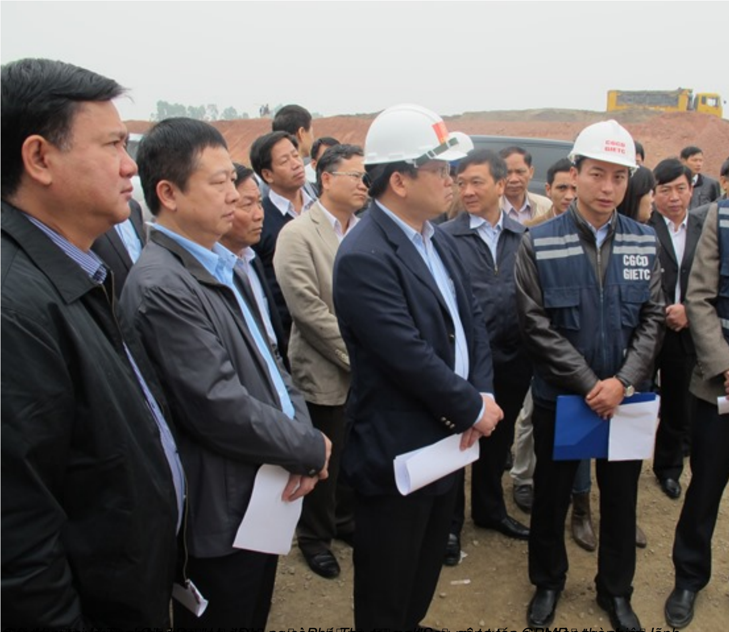
Chánh Văn phòng Ủy ban Chỉ đạo và Giám sát Dự án đường sắt cao tốc hiện đại ở miền Bắc và miền Trung