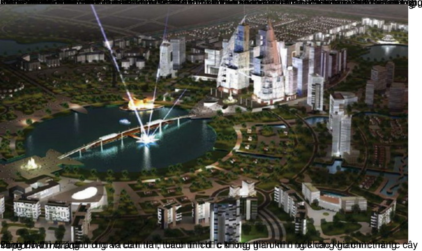
Đồ án quy hoạch tổng mặt bằng và cảnh quan, bản đồ định hướng không gian kiến trúc và cảnh quan chức năng cây