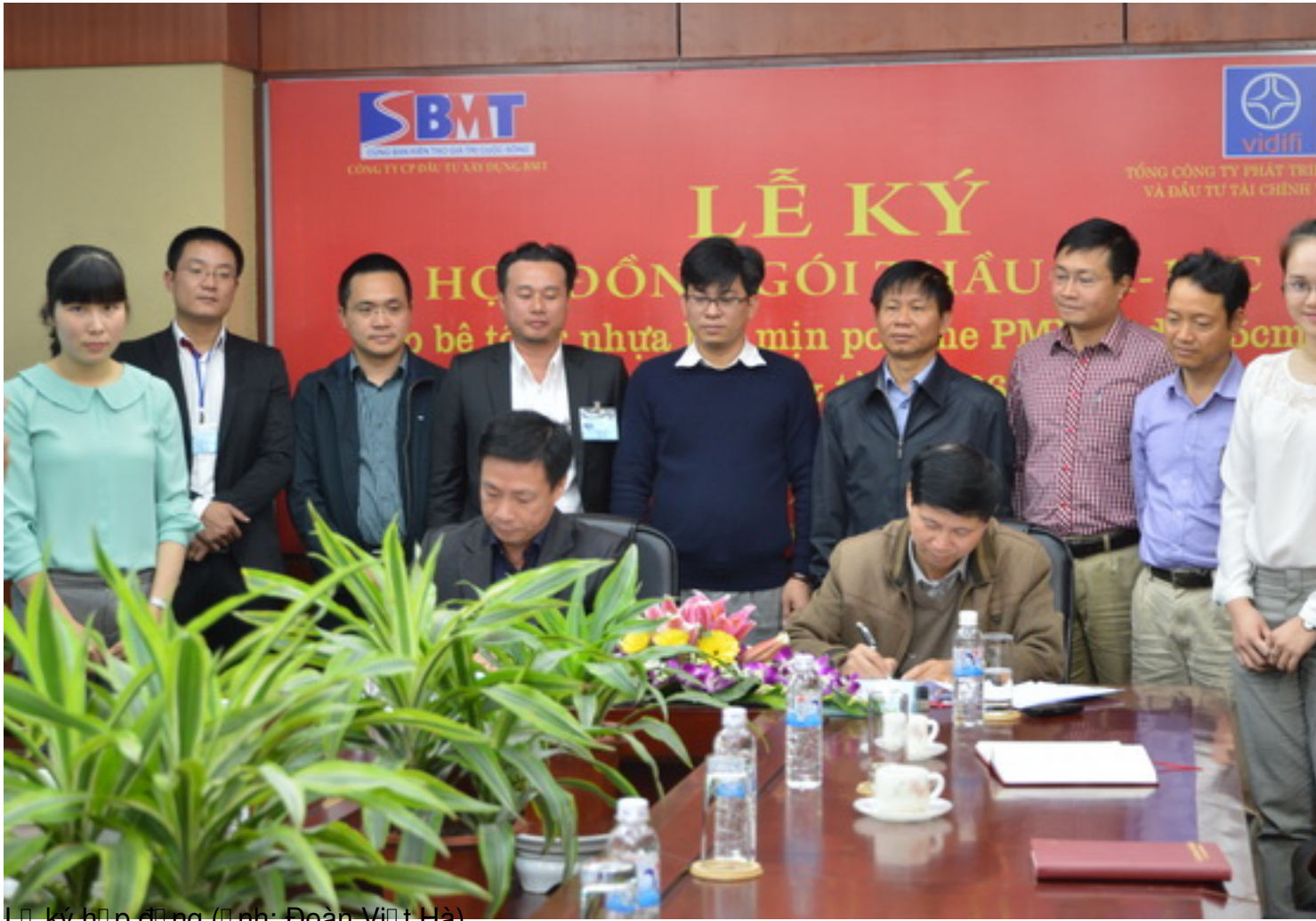
Lễ ký hợ p đợ ng (Đợ nh: Đợ an Viợ t Hợ)