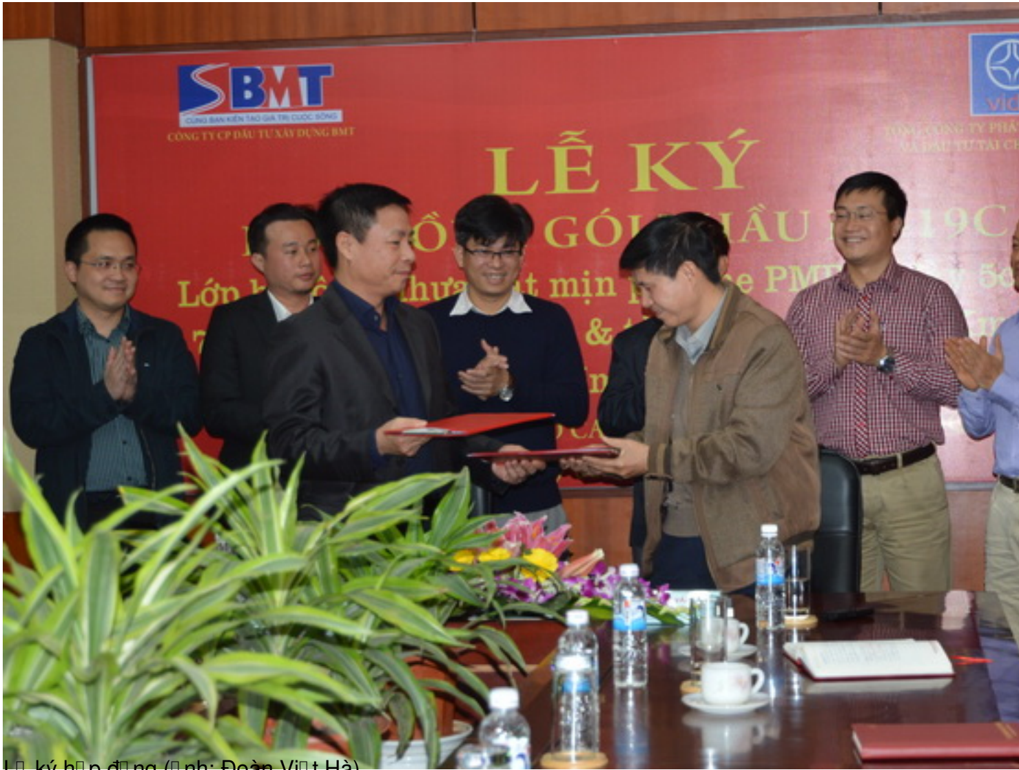
Lễ ký h p đ ng (nh: Đoàn Vi t Hà)