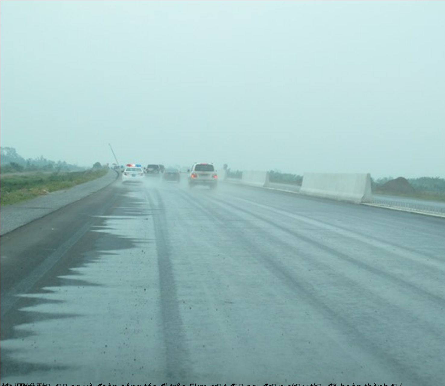
Đoàn công thợ đống và đống công tợc đống trên 5km mợ t đống đống, đống n chợ y đống đống hoàn thành đống i