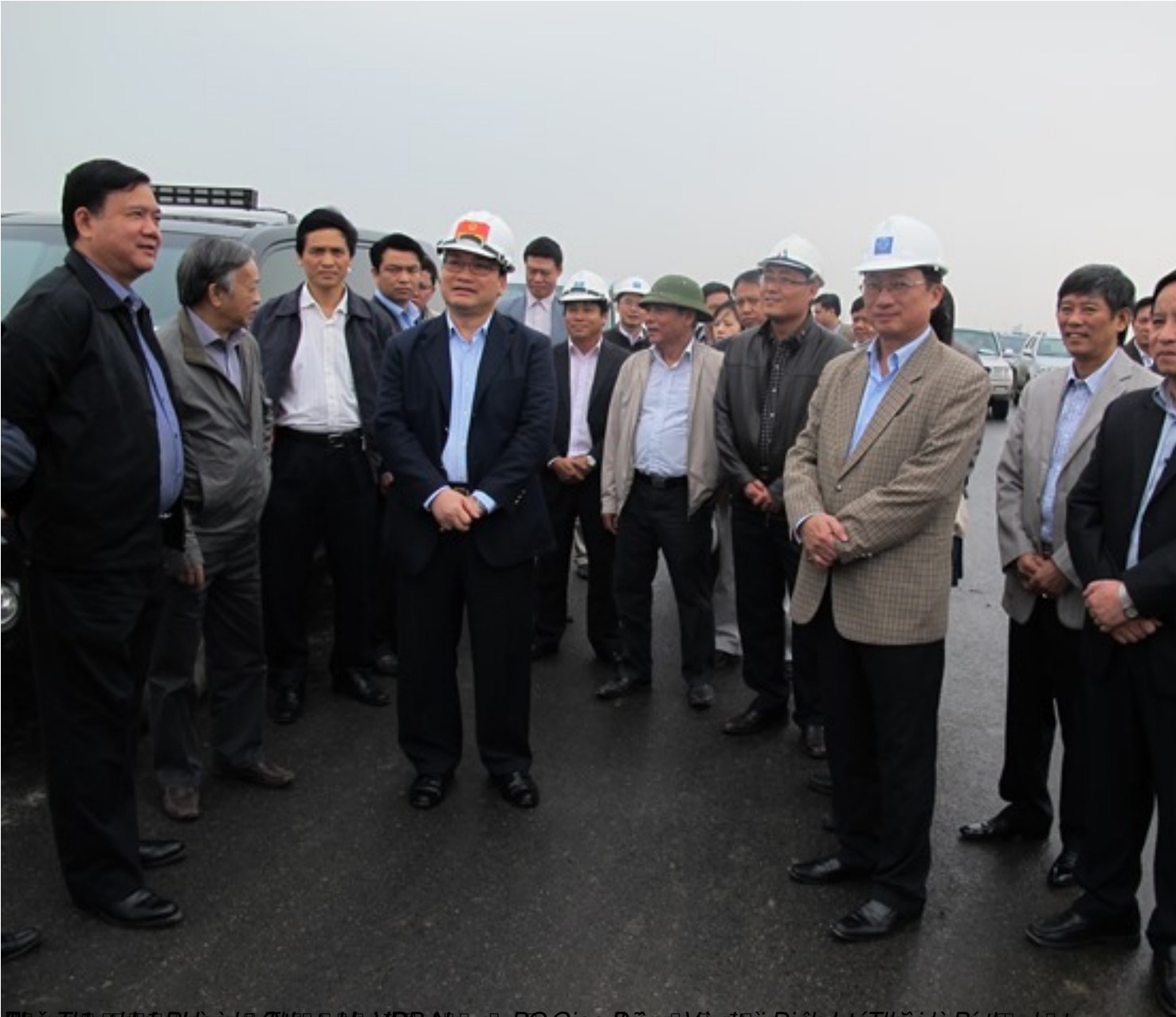
Phản ứng của các nhà đầu tư và các chuyên gia về dự án đường cao tốc Hải Phòng - Quảng Yên và các dự án khác của Bộ Giao thông Vận tải Đông và các thành phố và tỉnh